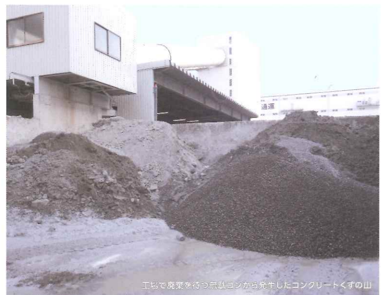
工場で廃棄を待つ無駄コンから発生したコンクリートくずの山