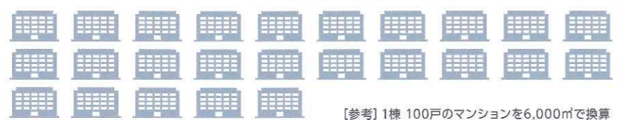
[参考] 1棟 100戸のマンションを6,000㎡で換算