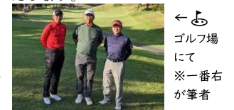
ゴルフ場にて ※一番右が筆者

父は鼠年でした。幼な心に何となく父が嫌いになったのを覚えています。お父さんごめんなさい!(笑) そんなことを思い出した5回目の年男です。本年もどうぞよろしくお願ひいたします。